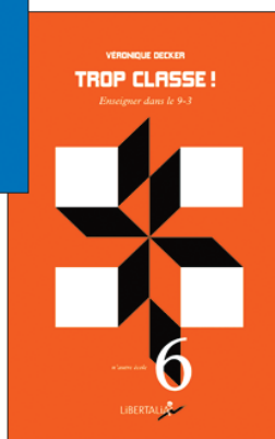
Trop classe ! Véronique Decker, coll. N'Autre École (n° 6), Libertalia, mars 2016 128 p., 10 €.

« L'école du peuple sera l'œuvre des éducateurs du peuple. », Célestin Freinet.